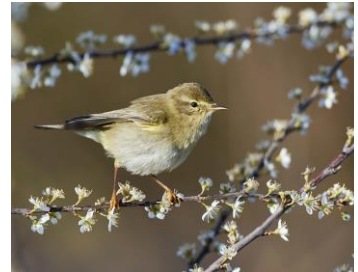
Fitis, Auried